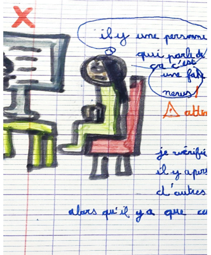
Illustration élève CM1A

« Attention aux informations qui tournent vite.. Il faut toujours vérifier la source et la fiabilité du site » .